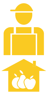
1. Exploitations à temps partiel

L'agriculture apparaît comme une activité secondaire qui complète d'autres sources de revenu, généralement pratiquée par de jeunes agriculteurs, qui l'exercent par choix personnel; une proportion élevée de la production est consommée par le ménage