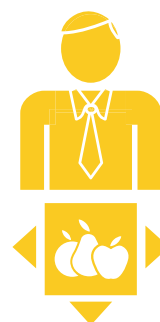
5. Entreprises polyvalentes

Le groupe le plus riche, relativement ancien et établi dans l'agriculture; large utilisation de la main d'œuvre; accès aux marchés via des coopératives, investissement dans la certification