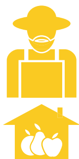
2. Exploitations traditionnelles en difficulté

L'agriculture apparaît comme une activité secondaire qui complète d'autres sources de revenu, généralement pratiquée par de jeunes agriculteurs, qui l'exercent par choix personnel; une proportion élevée de la production est consommée par le ménage