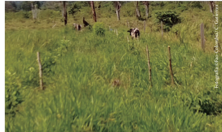
Imagen No 10. Pastoreo con ganado joven en sistema silvopastoril, en la vereda El Progreso, Calamar, Guaviare.

de formación haciendo el corte lo más cerca posible del tronco sin dejar muñones y sin dañar el cuello ni la corteza del arbolito; de esta manera obtiene una buena cicatriz e impide la entrada de enfermedades. Aplique cicatrizante en el corte luego de realizar las podas. Se recomienda iniciar con podas de formación a partir del primer año y al menos una vez al año durante los primeros siete años de establecido.