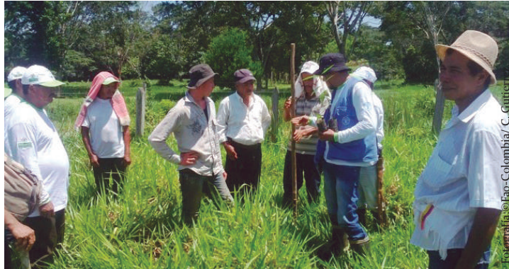
Imagen No. 5. Identificación de gramíneas y leguminosas en la vereda La Gaitana, en el municipio de Calamar, Guaviare.

El facilitador realizará las aclaraciones respecto a las inquietudes o dudas que tengan los participantes en torno a la temática abordada, teniendo en cuenta los siguientes criterios: