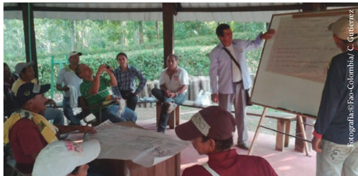
Imagen No. 4. Presentación de plenaria por parte de los productores, en la estación experimental El Trueno SINCHI.

Una vez cada grupo realiza su presentación, el facilitador debe reconocer en público el trabajo realizado por sus participantes, pidiendo a los asistentes un aplauso. Luego, el material utilizado para la plenaria, se ubica en un lugar visible durante el tiempo de duración de la sesión ECA.