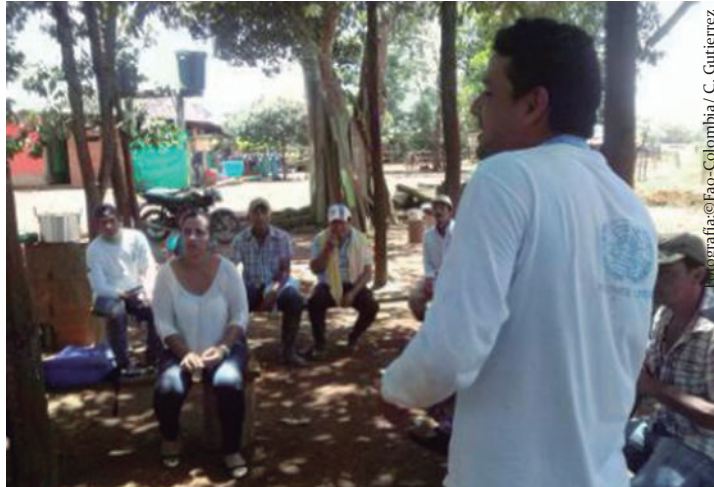
Imagen No. 12. Presentación en plenaria sobre el uso de recursos locales para el manejo de enfermedades bovinas.

Una vez cada subgrupo realiza su presentación, el facilitador debe reconocer en público el trabajo realizado por sus participantes, pidiendo a los asistentes un aplauso. Luego, el material utilizado para la plenaria, se ubica en un lugar visible durante el tiempo de duración de la sesión ECA.