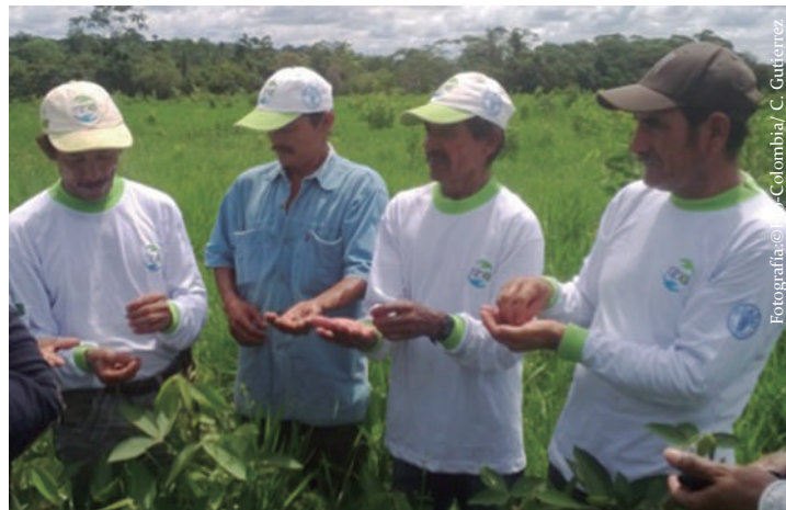
Imagen No. 13. Selección de semilla de Flemingia sp , en la vereda Diamante 2, Calamar, Guaviare.

ECA teniendo en cuenta criterios de calidad para selección de semilla, seguido a esta actividad se establecerán las semillas por varios métodos. Ej: embolsado, siembra directa, semillero. En la próxima sesión se analizarán y se sacarán conclusiones sobre las mejores prácticas para seleccionar y propagar material vegetal dentro de un sistema silvopastoril.