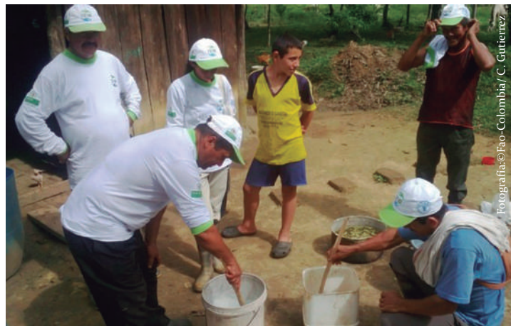
Imagen No. 11. Preparación de extractos vegetales para control de ectoparásitos en la vereda La Gaitana, Calamar, Guaviare.