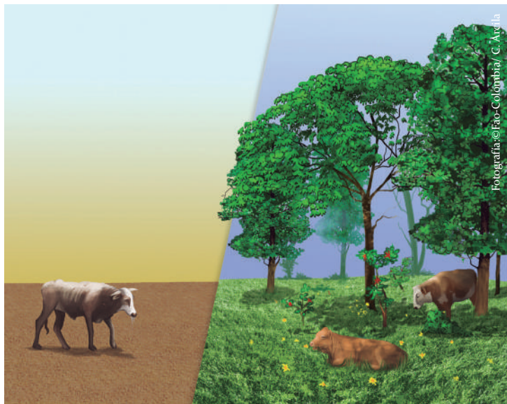
Ilustración No 2, Diferencias del confort animal bajo un modelo de ganadería convencional vs Sistemas silvopastoriles