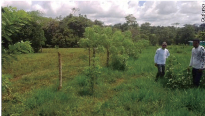
Imagen No 12. Cerca viva de matarratón en un sistema silvopastoril.