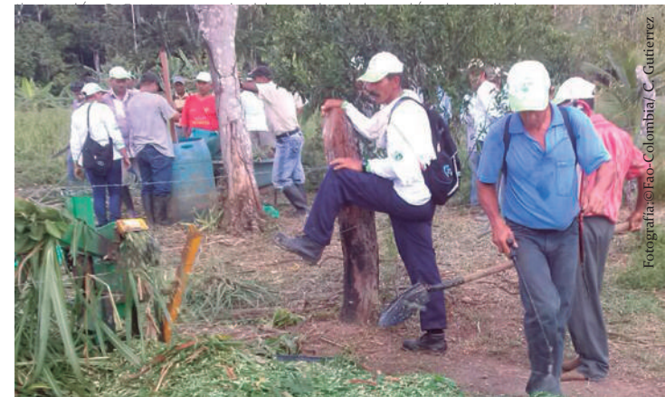
Fabricación de ensilajes, Vereda La gaitana.