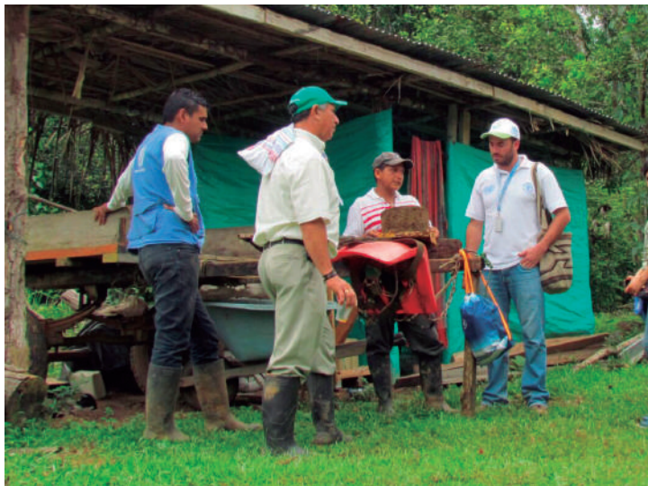
Fabricación de bloque multinutricional, Vereda La gaitana

Para esta actividad se recomienda realizar olla comunitaria, con el fin de ofrecer almuerzo para otros productores de la zona que deseen participar de la sesión sin previo aviso.