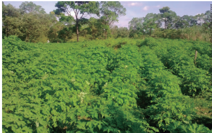
Imagen No 15. Banco de proteína con botón de oro, Tithonia diversifolia , en una finca en el municipio de San Martín, Meta.

Es utilizado en asocio con otras especies como la pimienta que sirve como tutor vivo. Al igual que las demás especies leguminosas, también es útil como banco de proteína. Esta especie también se usa para el establecimiento de cercas vivas 7 .