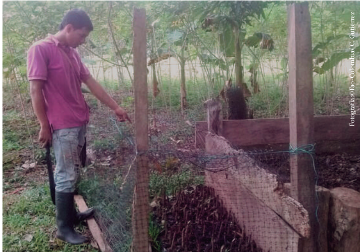
Propagación de especies forestales y arbustivas, Vereda Diamante 2