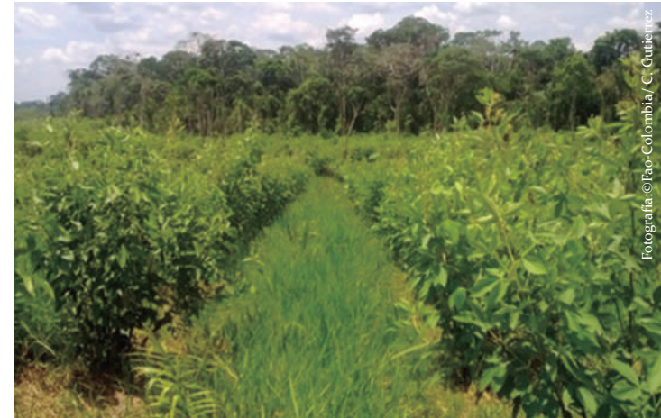
Imagen No 13. Surcos de flemingia en un sistema silvopastoril.

Esta especie se utiliza principalmente para cercas vivas, también para banco proteína. La densidad de siembra es de 1x1 metro cuadrado. Es una de las especies de mayor producción de biomasa (forraje) por unidad de área con 80 toneladas por hectárea al año con un porcentaje de proteína de 19.6% y se realizan entre cuatro y cinco cortes en el año. Además, es una especie recuperadora de suelos que han sido desgastados, mediante captación de nitrógeno de la atmósfera y su posterior incorporación al suelo.