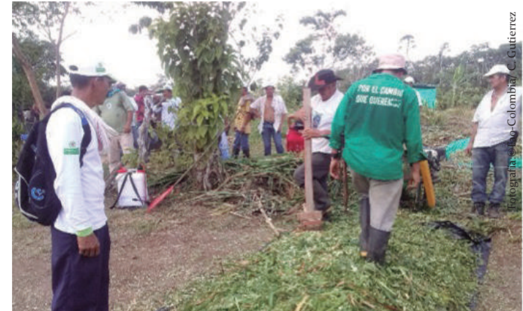
Imagen 14. Elaboración de ensilaje por montón, en la vereda La gaitana, Calamar Guaviare.

ilitador distribuirá las actividades entre los grupos así unos se encargarán de cortar el material otros de picarlo y así sucesivamente con cada uno de los pasos para la elaboración del ensilaje.