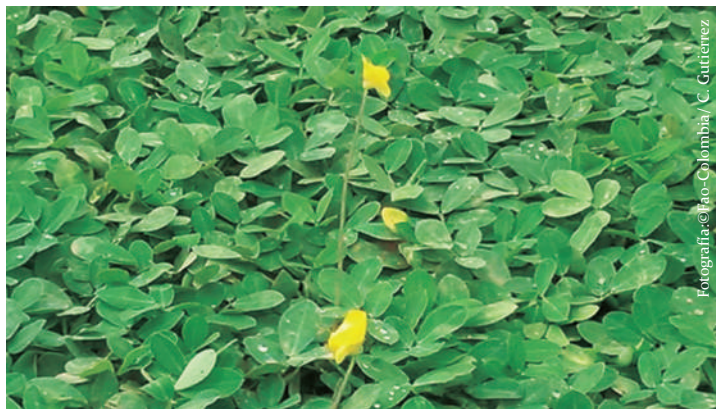
Imagen No 10. Maní forrajero, Arachis pintoi .

Son una familia diferente a las gramíneas, entre sus características principales están: sus semillas se encuentran dentro de vainas, las raíces poseen unos engrosamientos llamados nódulos que tienen como función fijar nitrógeno de la atmósfera e incorporarlo al suelo, pueden ser herbáceas, arbustos o árboles. Se destacan las siguientes: kudzu, maní forrajero, flemingia, cachimbo, matarratón, casco de vaca, cámullo, entre otros.