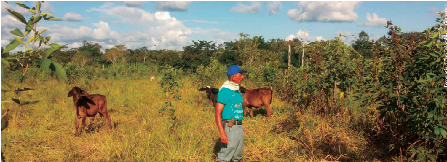
Fotografía: Jairo, Colombia, C. Gutierrez