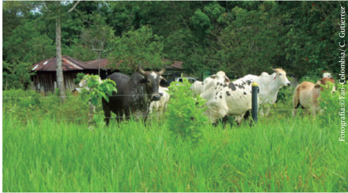
Sistema Silvo pastoril Vereda San Juan