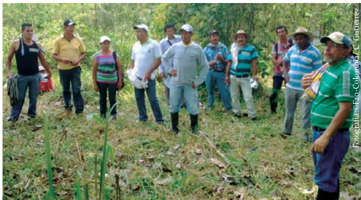
Imagen No. 3. Dinámica con productores en la estación experimental El Trueno - SINCHI.