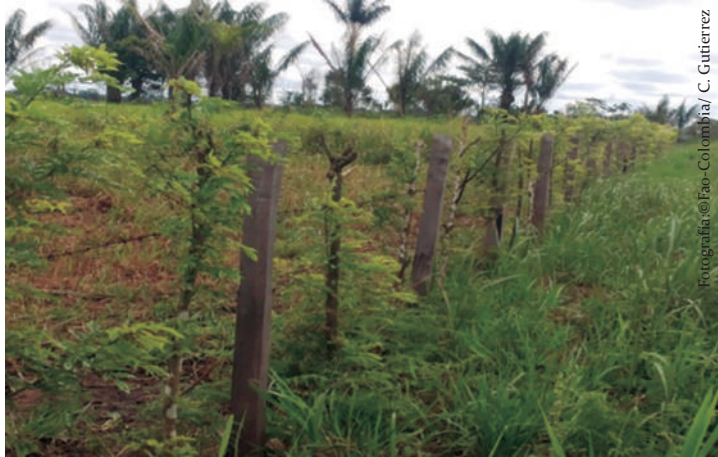
Imagen No. 7. Establecimiento de cerca viva en la vereda de Puerto Gaviotas, municipio de Calamar, Guaviare, en 2014.

El propósito primario de las cercas vivas es controlar el movimiento de los animales. Dentro de sus principales objetivos están mejorar las condiciones microclimáticas, delimitar áreas y servir como barreras. Las cercas vivas pueden proveer leña, forraje, alimento para el ganado, actuar como cortinas rompevientos y enriquecer el suelo, dependiendo de las especies que se utilicen.