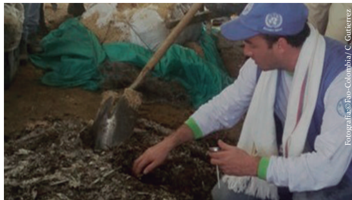
Imagen No. 8. Preparación de abono orgánico tipo Bokashi en la vereda Las Damas, municipio de Calamar, Guaviare.

Se puede preparar formando capas con los diferentes ingredientes, iniciando con la cascarilla de arroz, la tierra y el estiércol. Luego la capa de carbón y cal dolomita, los materiales deben quedar bien mezclados. La melaza y la levadura se disuelven en agua y se agregan a la mezcla final humedeciendo de manera uniforme. Los primeros cinco (5) días la pila de abono debe voltearse dos veces al día con el fin de airear para regular la temperatura, durante los 10 días siguientes se voltea una sola vez al día. Este abono está listo cuando su temperatura es igual a la temperatura ambiente, su color es grisáceo, queda seco y de consistencia polvosa. Es un abono con alto contenido de nitrógeno y una fuente de inóculo (microorganismos) para la descomposición de la materia orgánica.