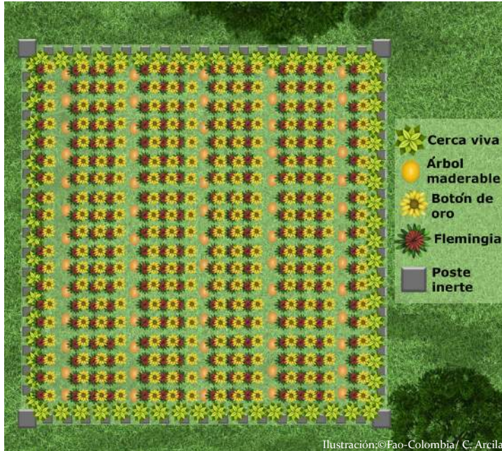
Ilustración 3. Diseño de sistema silvopastoril de ramoneo directo implementado en el municipio de Calamar, Guaviare.