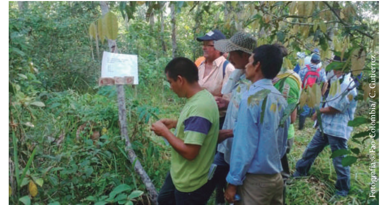
Imagen No. 1. Prueba de caja, sistemas silvopastoriles, estación experimental El Trueno (SINCHI).