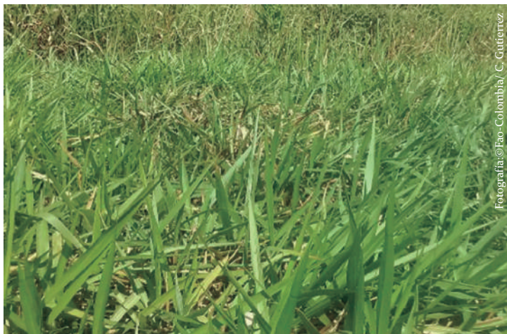
Imagen No 8. Pasto brizanta, Brachiaria brizantha marandú .

Manejo: Se utiliza en pastoreo directo y henificación, los primeros pastoreos deben ser suaves, hasta alcanzar una buena producción de forraje, el pastoreo rotacional es el más recomendado, pues este amplía los periodos de descanso.