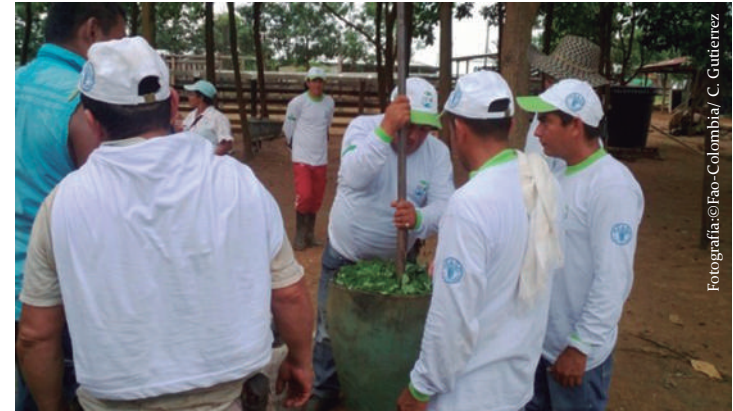
Imagen No. 9. Preparación de biofertilizante líquido arcagulin, en la vereda Las Damas, municipio de Calamar, Guaviare.

En la caneca de 200 litros agregamos el estiércol y se va llenando de agua paralelamente hasta completar 100 litros de agua con estiércol, luego en un recipiente de 100 litros mezclamos la melaza, la levadura, la roca fosfórica y el mantillo de bosque en 50 litros de agua, luego se mezclan ambas soluciones en la caneca de 200 litros mientras se le agregan los 5 kg bien picados de matarratón o la leguminosa de la finca, finalmente hasta completar 180 litros del biofertilizante listo para fermentar; tapamos con un costal cebollero o lienzo para permitir la entrada de aire. Hay que tener en cuenta que esta fermentación tiene una duración entre 35 y 40 días sujetos a las condiciones climáticas de la zona. Dosis entre 2 y 3 litros/ bomba de espalda 20 litros Para forrajear y maderables, al igual que para frutales.