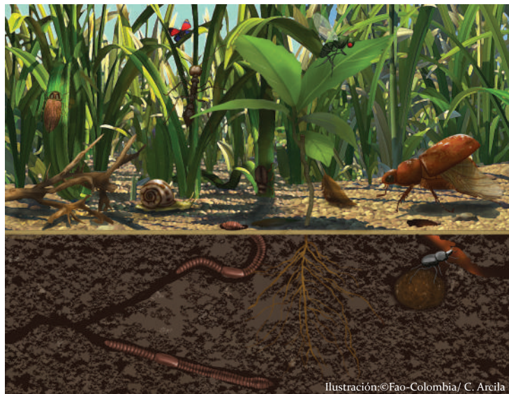
Ilustración 5 Beneficios de considerar al suelo como organismo vivo

a las plantas todo lo que ellas necesitan y que el suelo necesita de las plantas y la acción de los diferentes organismos que viven en él para poder vivir, ciertamente existirá un equilibrio ecológicamente eficiente en los sistemas productivos.