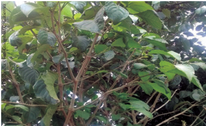
Imagen No 14. Nacedero o quiebra barrigo, Trichanthera gigantea