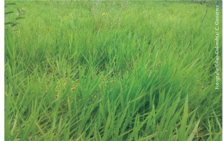
Imagen No 6. Pasto amargo o pasto decumbens, Brachiaria decumbens .