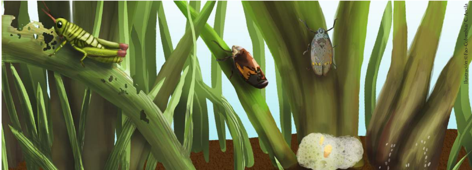
Ilustración © Fao - Colombia / C. Arcila